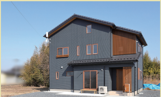
ブラックのクールな外壁と屋根にサッシや玄関周り、軒天に木のぬくもりを添えた外観。木の縦格子が和モダンな印象