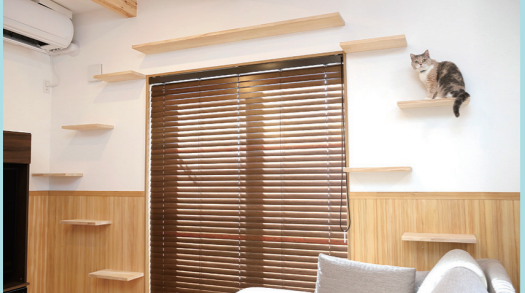
リビングの窓の周りにアシンメトリーに配したインテリア性にも優れたキャットウォーク。窓には木のブラインドを採用