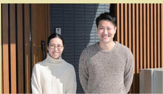
CASE66:宮城県栗原市 Mさんのお宅 家族構成:ご夫婦、愛猫2匹 延床面積:約38坪 4LDK+小屋裏収納 こだわり設備:モミの木の床、スピノフ