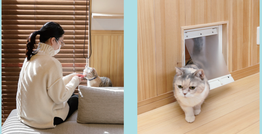
奥さまの手からおやつをもらう、お互いに幸せな時間 扉を開けても双方向に出入りができる猫用のくぐり戸