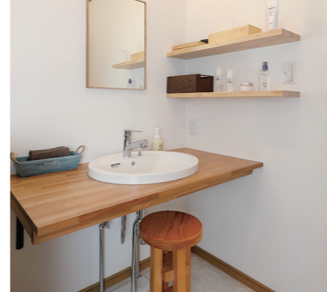
木のぬくもりあふれるオーダーメイドの洗面台。椅子は奥さまの父の手造り