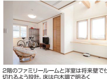
2階のファミリールームと洋室は将来壁で仕切れるよう設計。床は白木調で明るく