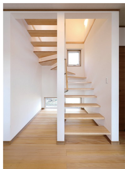
リビングの引き戸開けると現れるスケルトン階段は見通しが良く、階段の先に庭の緑が見える。踏板は愛猫の居場所になることも