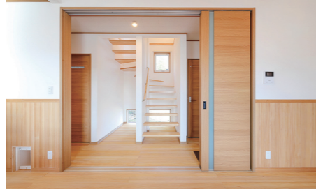
リビングと階段ホール間に3枚の引き戸を設け、プライバシーに配慮。開放した引き戸は壁に収納できる