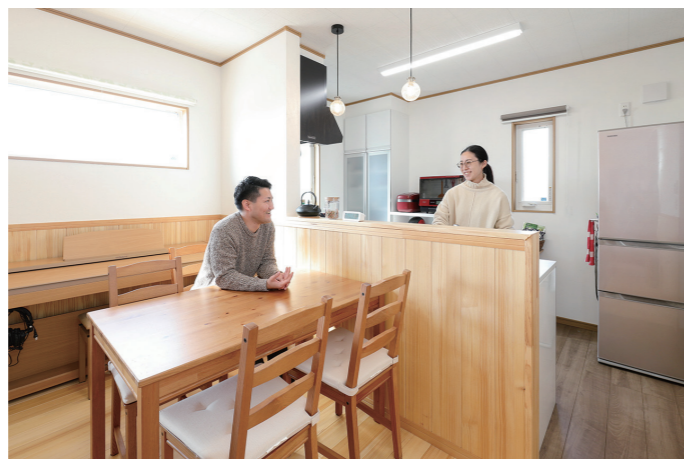
「壁に向かって料理をするのが嫌で」という奥さまが希望した対面式キッチン。モミの木の前壁が手元を隠し生活感を感じさせない。キッチンや背面収納は白で統一

趣味を楽しむ小屋裏収納やトレーニングルーム、 光あふれるリビング。健康的な暮らしを日々楽しんでいきます。