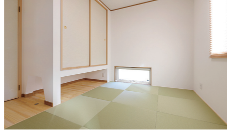
リビングを通らず玄関や水廻りと行き来ができる和室は来客の宿泊やおもてなしにも。緑なし量が印象的