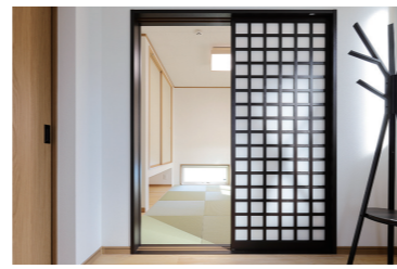
玄関ホールの正面には柔らかな光を通す障子の引き戸。黒の格子が和風を演出