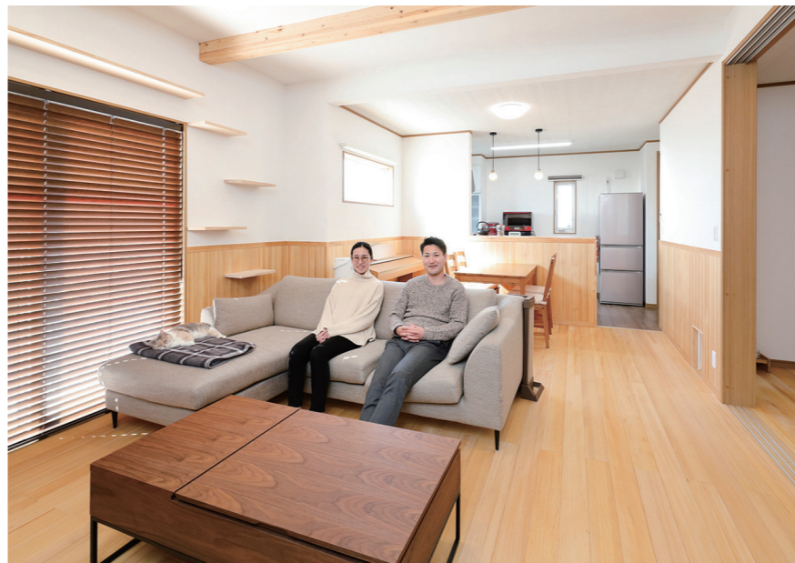
床、腰板、キッチン前壁にもモミの木を贅沢に使用したリビング・ダイニング。空気中のホコリやチリなどを吸着しニオイを抑えるスピノフ壁をも採用し、空気がさわやか。天井の梁はアヴィエスホームの提案

森の中のような清々しい空気 家族も愛猫も心から寛げる 「おうち時間を充実」の住まい