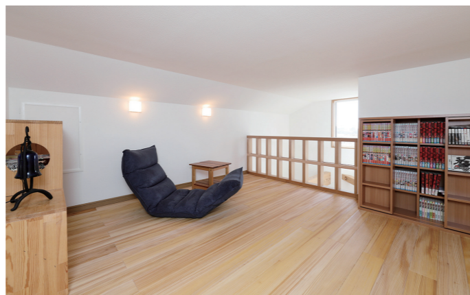
十分な広さの小屋裏収納は奥さまが漫画を読むホビールーム的な空間。格子手摺りで吹き抜けとつながり、南面の窓から自然光が射し込む。床にはモミの木を採用

いつかマイホームを建てたいと、モデルハウスを10軒以上見学したMさん夫妻。「インドア派で家にいるのが好きなので、多少お金をかけてモリラックスできる居心地のいい家をつくりたい」と思っていましたと話すご主人。アレルギー体質で、新築特有の匂いに具合が悪くなり、蕁麻疹が出ることもあった奥さまは「アヴィエスホームのモデルハウスに入ると、空気がきれい」「この家がいい！」と感心していました。営業の村上さんを「はじめ、スタッフが親身で話しやすいことも決め手になりました。」「間取りを決めるときもスムーズで、素人が気が付かない細かいところまでアドバイスをしてくれました」と振り返ります。 リビング・ダイニングはもちろん、和室の板の間や小屋裏にまでモミの木をふんだんに使った新居が完成。トレーニングルームでは夫婦で汗を流したり、小屋裏で本を読んだり、お互いの気配を感じながら、それぞれが趣味や好きなことを楽しんでいきます。愛猫は、キャットウォークを思いきり駆け上り、木の上でリラックス。「賃貸アパートのときは壁紙で爪とぎをしたり、外に逃亡することもありました。今は安心」と、ご夫妻の笑顔に響き、心がほぐれます。奥さまの体調も良く、快適だそう。「こうすれば良かった、ということはありません。目指していた、心から寛げる家ができました」と、健康かなおうち時間を満喫されています。