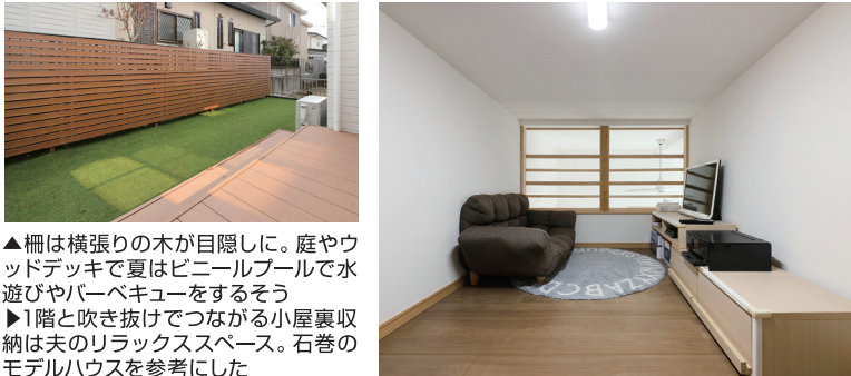
▲柵は横張りの木が目隠しに。庭やウッドデッキで夏はビニールプールで水遊びやバーベキューをするそう ▶1階と吹き抜けでつながる小屋裏収納は夫のリラックススペース。石巻のモデルハウスを参考にした