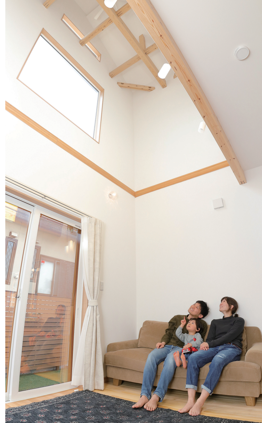
ご主人が希望したリビングの吹き抜けは2階、小屋裏収納まで続く圧倒的な高さを実現。ソファに座って高い位置に設けた大きな窓から青空を流れる雲や夜空に浮かぶ月や星を眺めるのは楽しいひと時。時には床に寝転んで格子に組んだ木の梁を見上げることも

高い吹き抜けのリビングから 窓に映る雲・星・月を眺める 子どもたちの夢を育む住まい