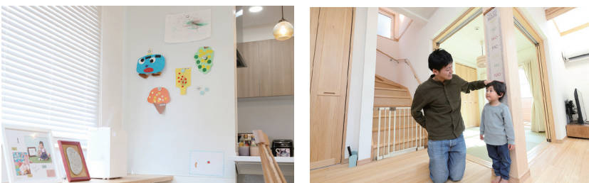
キッチンの前に将来のために宿題スペースを設けた。長男が描いた絵などが貼れる壁パネルを採用