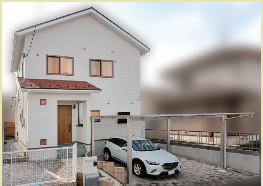
温かみのある屋根の色はご主人が直感で選んだ新色。アプローチや外構も明るい南欧風の外観と素敵にコーディネート