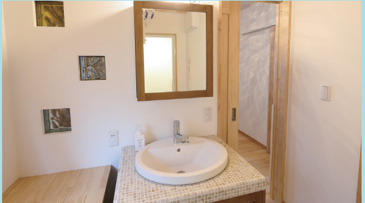
帰宅してまず手を洗えるよう玄関ホール脇に設けた洗面所。タイルと洗面ボウルなどを選んで造作した洗面台がオシャレ