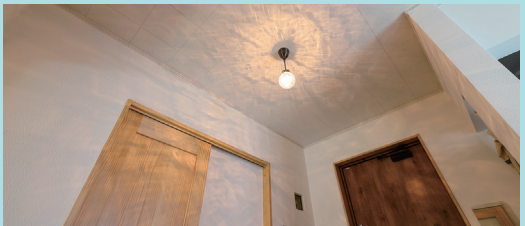
照明は奥さまがネットで吟味してチョイスして採り入れた。光が天井に作る模様も広がりゆらめく様子を見るのが楽しい