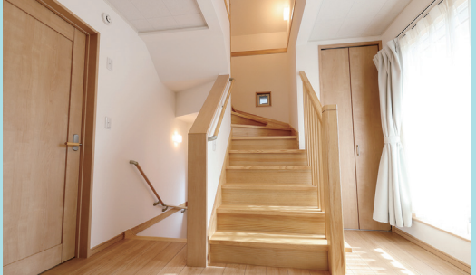
2階ホールの南側は明るく洗濯物を干すのに最適。風が通るよう網戸付きの小窓を設けた。小屋裏収納へは階段を使って