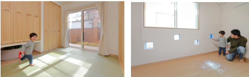
襖を開けるとリビング・ダイニングと一体になる和室はお昼寝にも便利で「作って良かった」そう