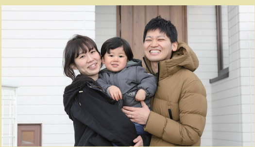
CASE65:宮城県仙台市泉区 Tさんのお宅 家族構成:ご夫婦、長男 延床面積:約35坪 4LDK+小屋裏収納 こだわり設備:モミの木の床、スピノフ