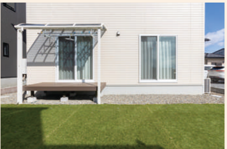
屋根付きのテラスでは洗濯物を干したり、暖かい日は日向ぼっこも。庭には人工芝を敷いて見た目も楽しく