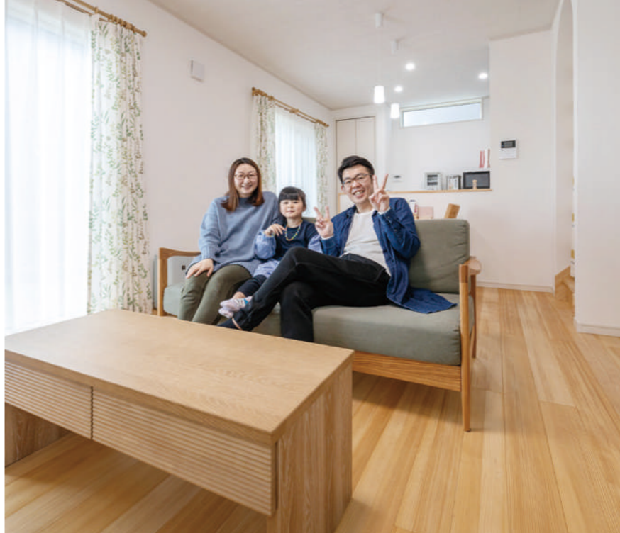
断熱性が高く冬も暖かく快適なリビング・ダイニング。「木が好きになり、家具も床に合わせて木製を選びました」と奥さま。明るさを印象づける白壁はニオイを吸着し、冷暖房の効きも良くなるスピンオフを採用

難しい土地探しに奮闘した 担当者らと楽しくつくった家。 住んでますます楽しく快適！