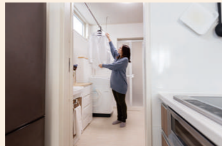
広々としたランドリールーム兼洗面室は玄関ホールからも直接入れる。洗濯物の室内干しもこの場で解決