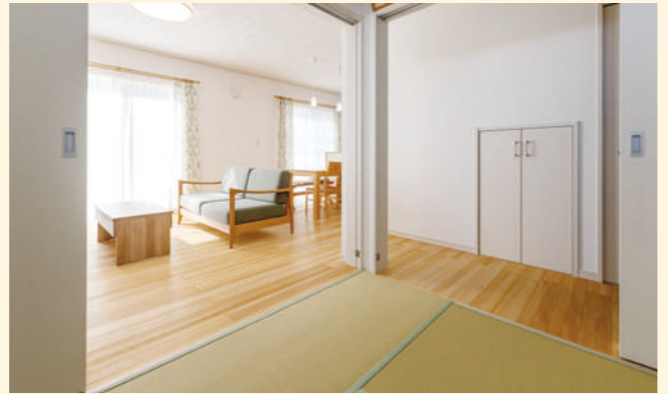
和室の引き戸を柱を中心に両側に開放するとリビング・ダイニングと一体となり、広々と使える。独立した居室や娘さんの遊び場などにも便利。デザイン畳が素敵