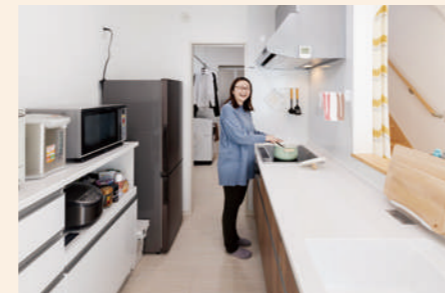
対面式キッチン。カウンターとシンクは人造大理石を採用。火を使わず安全、空気を汚さないIHヒーターで調理