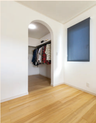
寝室に設けたウォークインクローゼットの入口はアーチ状で可愛く