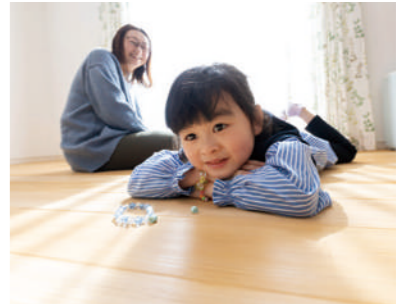
「アパート住まいの頃は、走らないでと注意しましたが、今はいくらでも走り回れますね」と、娘さんを優しい表情で見守る奥さま

S様と初めてお会いしたのは完成現場見学会でした。当初は地元工務店で計画しているとのことでしたが、モミの木を忘れられなかったのか私を忘れられなかったのか十一月三日の文化の日、利府展示場に足を運んで頂きました。その後は土地探しに奔走する日々。地元の不動産屋さんにも何度足を運び、S様が気になる空き地をみつけたら持ち主の所へ顔を出し、と約2か月動き回ってようやく出会った運命の土地。私もS様も即決できる土地に出会えたのはS様ご家族の熱意と情熱のおかげです。建物の打合せが始まってからは、お子様もどんどんスタッフと仲良くなったり、とても楽しい打合せの時間を過ごせました。実際に工事が始まってからも大きなトラブルもなく順調に完成を迎えられ、私たちもとても満足しております。今後とも未永いお付き合いを宜しくお願い致します。また一つ、私の自慢の家が増えました。 営業担当 青木