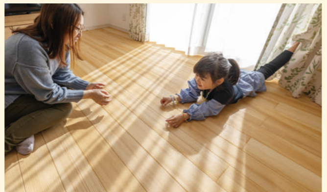
柔らかいリビング・ダイニングの床で娘さんはダンスを踊ったり逆立ちの練習などもするそう。モミの木の床は、睡眠中も快適に過ごせるよう夫婦の寝室にも採用

モミの木の床は冬も冷たくならず暖かい。 フローリングの部屋と比べると全然違いますね