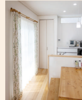
キッチンには吊り戸棚を設けず中身を取り出しやすいパントリーを設置