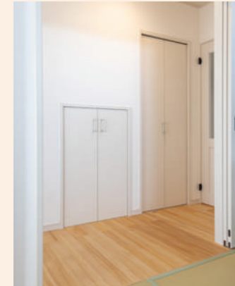
玄関に近い所に設けた階段下を利用した収納は娘さんのものなどを収納