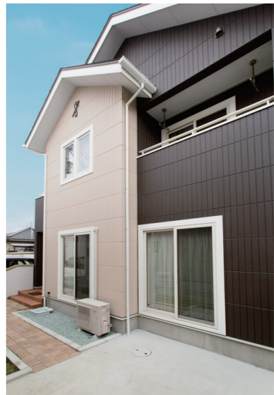
夏には家族が庭で遊べるように南側に大きな窓を設置