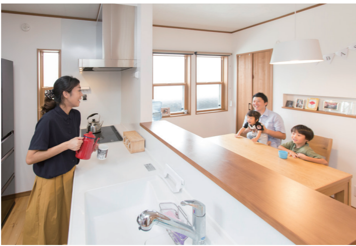
ご主人との会話も弾む対面式キッチン。壁も天井もつなぎ目がなくお手入れがしやすい。子どもにもやさしい遠赤外線クッキングヒーターのDGHを採用