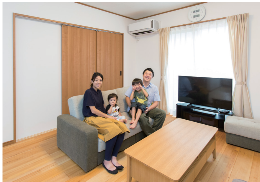
伸びやかなリビング・ダイニングでゆったり過ごすAさま。床はすべてモミの木、壁はすべてスピンオフを採用した空気がきれい健康的、夏は涼しく冬は暖かい家

小さいときからアトピー・性皮膚炎の症状に悩まされてきた奥さま。アヴィエスホームがアレルギーやアトピーにやさしいと聞いて、モデルハウスへ。そこでお母さまの知り合いの営業担当と会い、縁を感じると同時に、新築住宅独特の不慣れなニオイがなく、気持ちのいい木の香りの家が見つかり気に入りました。夫婦で住宅展示場を見学した後の積極的な営業姿勢からマイホームへの熱意が薄れていった奥さまも、モミの木の家を見て話を聞いて納得、あっという間に契約しました。「家づくりに関わる全員が熱心で温かい。実際に住んでみて性能も使い勝手もいい、不満のない家ができました」と実感した奥さま。その後、30才の節目を機に営業職への転職を考え、アヴィエスホームに入社することに。「自分にウソをつきたくない、一番好きなものを買りたい」と考えたならこの家でした。私以上にアヴィエスファンの妻が「この家の良さはみんなに伝えるべき」と後押ししてくれました。入社後も、見えないところでお客様のために一生懸命な姿を見て、ますますアヴィエスファンに。「妻や長男のアトピーも改善し、風邪もひかなくなったのはこの家のおかげ。自信をもってお客様におすすめしています」と話す奥さまは帰省して「お帰りの家」と家族と木の香りが迎えられるたびに、しみじみと幸せを噛みしめているそうです。