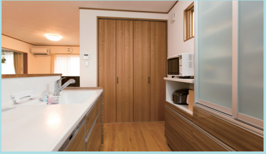
キッチンには見やすく取り出しやすくしまえるパントリーと食器棚を設置。扉も木目調でトータルコーディネート