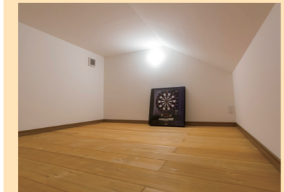
使用頻度の少ないモノの収納に便利な小屋裏収納は、ご主人のホビー空間、子どもの隠れ家にも