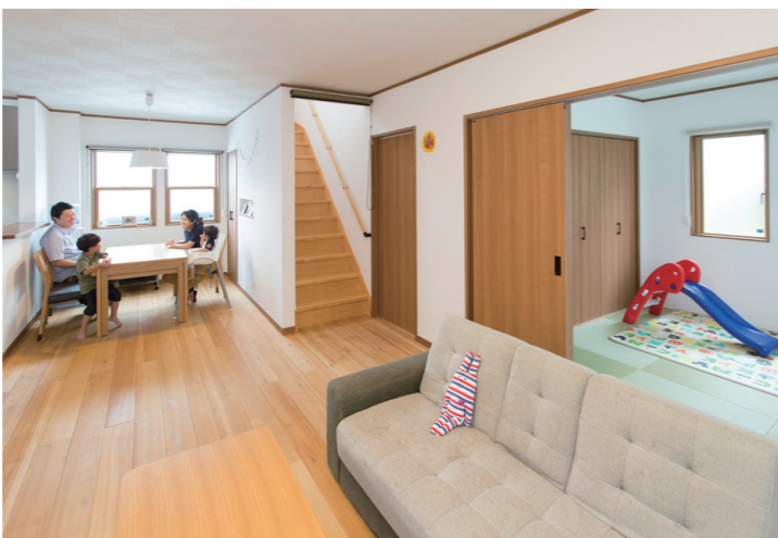
広々としたリビング・ダイニングを中心とした間取りは暮らしやすさひとときわ。和室は仏間やゲストルームに、リビングの続き間として子どもの遊び場にも

「この家に住んで家族がみんな健康になりました」と笑顔で話す奥さま。一番のおすすめは、森林浴効果、空気の浄化、消臭効果があるモミの木だそうです。