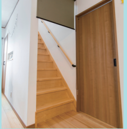
リビング階段の出入口にロールスクリーンを設けることで冷暖房効率をアップ