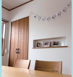
いつも眺めていたい思い出の写真は壁を生かしたニッチで場所をとらずに飾れる