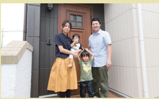
CASE56:宮城県仙台市 Aさんのお宅 家族構成:ご主人、奥さま、ご長男、ご次男 延床面積:34坪、4LDK こだわり設備:モミの木の床、スピンオフ