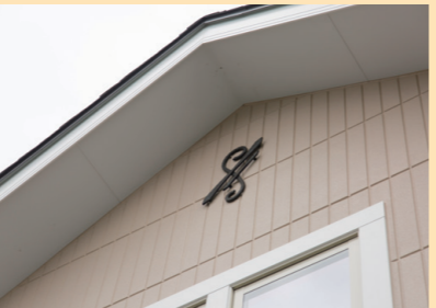
個性を演出する妻飾りは長男の名前にちなんだモチーフを選択。親子の絆がうかがえるエピソード