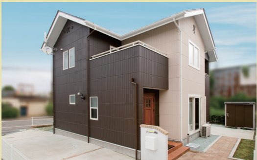
外壁は飽きのこないブラウン系にしながらくならないように濃淡の二色使いで明るい印象にした