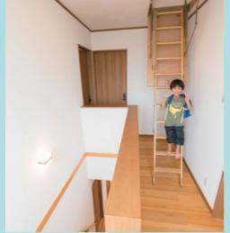
格納式のはしごで昇る小屋裏収納は小さい子どもにとってワクワクする遊び場