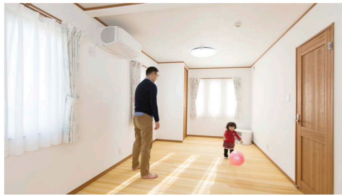
子ども部屋は、2つの扉と2つのクローゼットを設けた広々ワンルーム。将来のライフスタイルの変化に合わせて2部屋に分けられるよう中央に下がり壁を設置