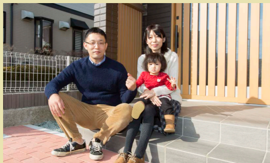
CASE52:名取市 Kさんのお宅 家族構成:ご主人、奥さま、ご長女 延べ床面積:約34坪、3LDK こだわり設備:モミの木の床、スピンオフ

玄関に入った瞬間から、ふんわりとやさしい木の香りに包まれるKさんのお住まい。育ち盛りのお子さんはもちろん、「家に帰ると鼻がグズグズしない」というご主人も新居のさわやかな空気を思いきり深呼吸して健やかに暮らしています。