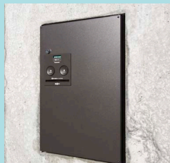
荷物の受取りに便利な宅配ボックスを外構にスッキリと埋め込みました