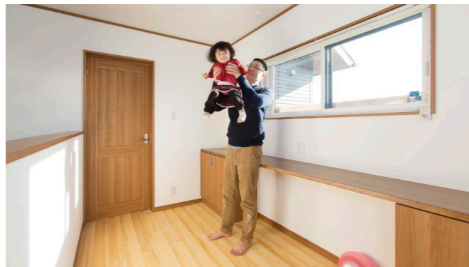
「限られた空間を広く有効に使いたい」という奥様の希望により2階はベランダをなくし、ホールにデスクと収納を造りつけてお子さんの書斎スペースを確保