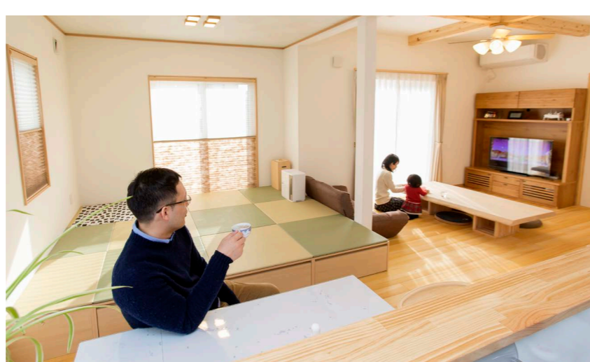
「ダイニングでお茶を飲みながらリビングの梁や木の空間を眺めているときに、家を建てて良かったと思えます」とご主人。休日は出かけるより家にいることが多く、外で飲む機会も少なくなったそう

玄関に入った瞬間から、ふんわりとやさしい木の香りに包まれるKさんのお住まい。育ち盛りのお子さんはもちろん、「家に帰ると鼻がグズグズしない」というご主人も新居のさわやかな空気を思いきり深呼吸して健やかに暮らしています。