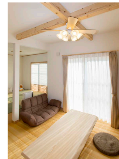
あらかしの梁とシーリングファンは木が好きなお主人が希望。梁は杉の無垢材、天井は有害物質や音を吸収するソフトーンを採用