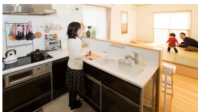
お子さんが遊ぶ姿を見ながら調理ができるL字型キッチンは、壁付けと対面式のいいとこ取り。ダイニング側はモミの木の腰壁で手元と生活感を隠しています