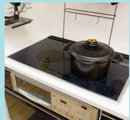
遠赤外線クッキングヒーターDGHで炊くご飯はご主人が絶賛する美味しさ