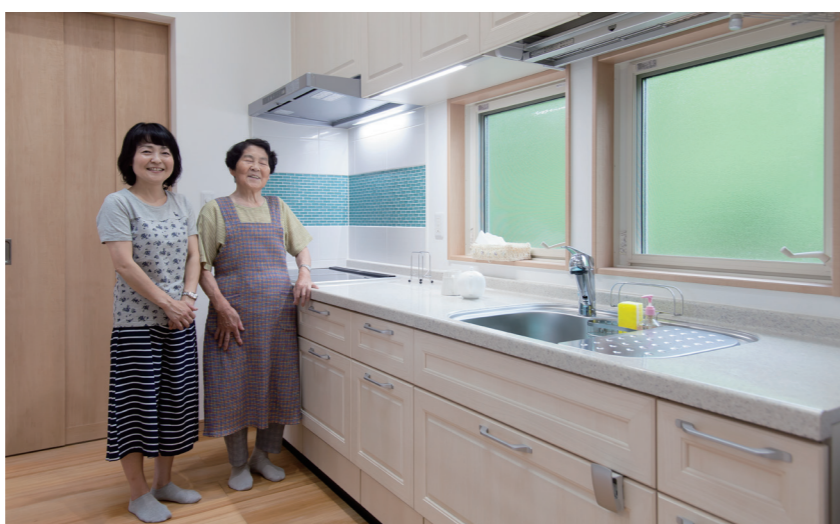
2人でゆったり作業できる広々キッチン。DGHコンロの上のブルーのタイルが素敵なアクセントに。木製ドアの奥はたっぷり入る食品庫。