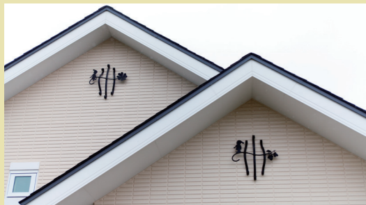
Tさん宅の家づくりのイメージ「小人」のモチーフの妻飾り。楽しそうにおしゃべりしています。