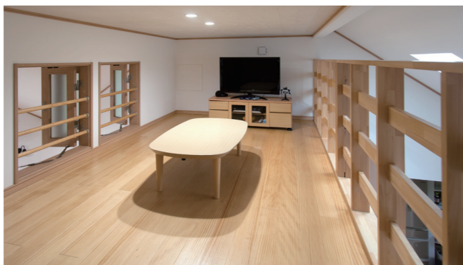
石巻店のモデルハウスを参考にした小屋根裏収納。収納スペースの奥の心地よい空間はセカンドリビングに。

部屋に入ったときにふと感じる床の美しさ。聞けば奥さまは毎日水吹きをしていそう。床暖房の際にモミの木の乾燥を防ぐために始めたそうです。手入れされ、大事にされているモミの木は語りかけてくるもの。だんなスタッフ一同感慨深い思いでした。