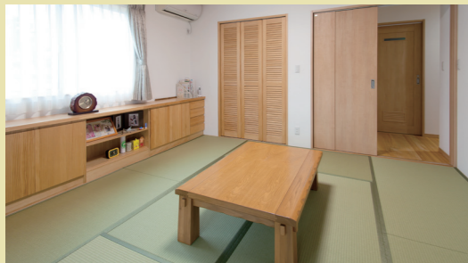
クローゼットや窓下のカウンター収納など造り付けの家具ですっきりと居心地の良い和室。