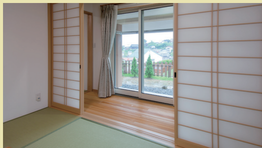
和室(お母さまの部屋)には日当たりの良いモミの木の床の縁側を設けました。夏の強すぎる日差しを避けるための庇は、以前の家に似せて設けたもの。お母さまへの思いが伝わってきます。

家族構成:ご主人、奥さま、お母さま 延べ床面積:約34坪 3LDK こだわり設備:モミの木の床、スピンオフ