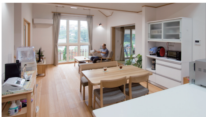
キッチンから眺めたリビングダイニング。手前の作業台は家電やゴミ箱を収納。空間を仕切りながら、シンクの目隠しになります。