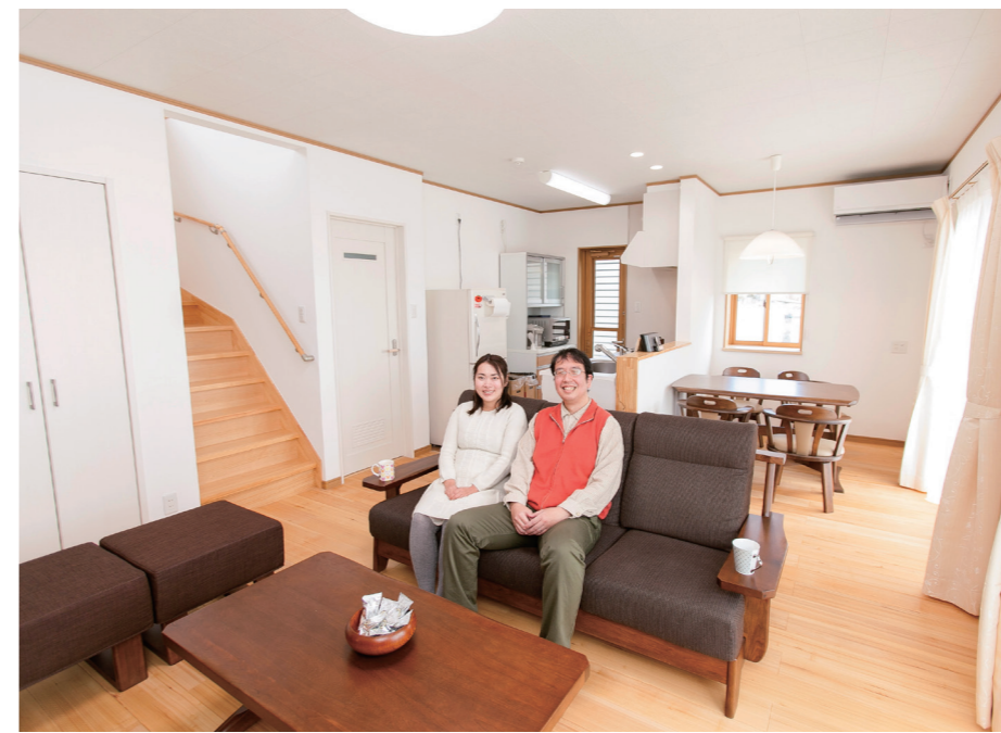
日当りの良い広々としたLDK。廊下のない間取りなのでトイレや洗面などへもドア1枚で行けるコンパクトな動線。