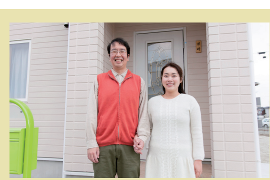
CASE43:宮城県亘理町 Hさんのお宅 家族構成:ご主人、奥さま 延べ床面積:33坪 部屋:4LDK こだわり設備:モミの木の床、スピンオフ

「心地よく、早く帰って来なくなる家です」とご主人がいえば、「くつろげるので、夜ぐっすり眠れるようになりました」と奥さま。心からモミの木ファンになって頂いたように、モミの木に癒されています。仲の良いお二人でした。