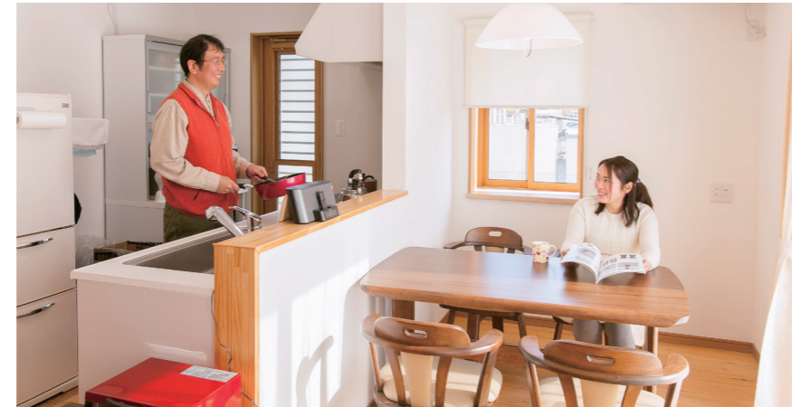
キッチンにはシンク上部に収納を付かずダイニングと一体感を。遠赤外線調理するDGHIは、和食が得意なご主人も「料理すると卵焼きがふわっと仕上がります」とお気に入り。

「心地よく、早く帰って来なくなる家です」とご主人がいえば、「くつろげるので、夜ぐっすり眠れるようになりました」と奥さま。心からモミの木ファンになって頂いたように、モミの木に癒されています。仲の良いお二人でした。