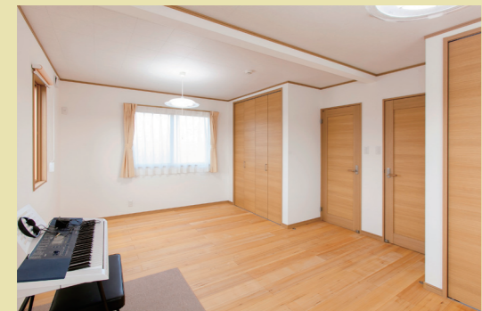
将来のお子さんのために中央に間仕切りができる仕様になっています。