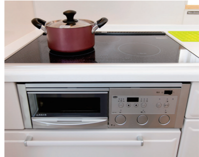
DGHで湯を沸かすと遠赤外線効果で水がアルカリ性に。奥さまは外でもこの水が飲みたくて、水筒に白湯を入れて外出するそう。