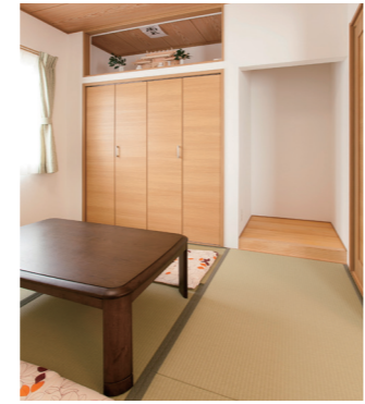
落ち着ける空間としてぜひ欲しかったという和室。将来の育児や介護も含め、汎用性の高さが魅力です。