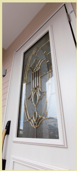
飽きの来ないシンプルな外観の中で目を引くデザインの玄関ドア。奥さまのお気に入りです。