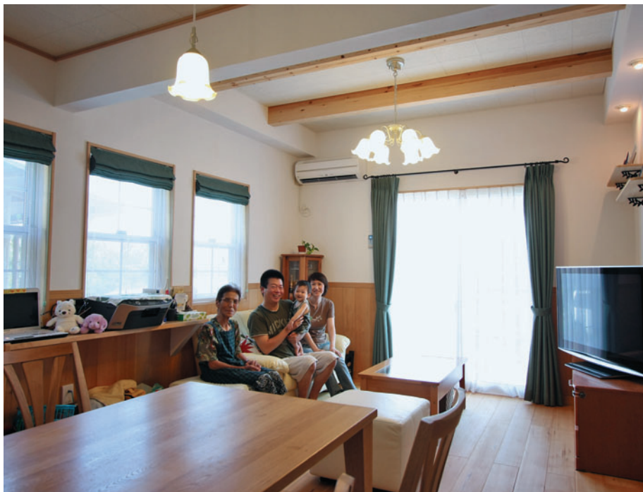
リビングは梁のある天井にすることで、高さや雰囲気のある空間に。もみの木の腰壁とグリーンカーテンのコーディネートで「森」のイメージにしました。3つ並んだ窓も部屋のアクセントにもなっています。

生まれてくる子どもたちのためにも 森の中にいるような 安心してくつろげる家に。 田んぼや木々を抜ける風が 気持ちのいい立地。 家の中も自然を感じる「いい空気」の 快適な暮らしがご希望でした。