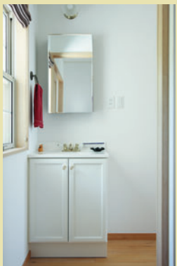
朝晩の身支度に便利な2F寝室前の洗面コーナー。洗面台、収納付き鏡、タオルハンガーなど好みのものを揃えました。