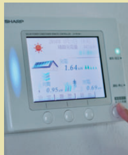
家計の節約と省エネのエコ生活を実現する太陽光発電システムは、しっかりもの奥様のご希望。「5月ごろは屋間に発電した電気が余ってかなり売電できました」