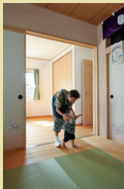
豊のある部屋が欲しいと仏間に配した畳は、ごろんと寝転んだりできる癒しのスペース。奥はお母様の部屋。引き戸を開ければ2間続きになり、ご近所付き合いで大勢の来客があっても便利に使えます。