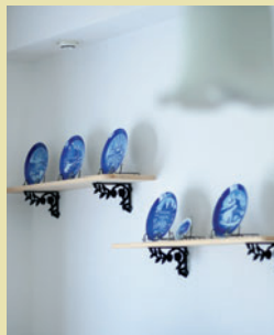
部屋が明るく見えるように白い色にしたというスピンオフの塗り壁。奥様が集めているイヤークラートのブルーがおしゃれに映えます。棚はご主人が選ばれました。

家族構成:お母さま・夫・妻・長男(1歳) 延べ床面積:43坪 部屋5LDK こだわり設備:1F、2Fオールもみの木フロア スピンオフ塗り壁 リビングモミ腰壁 太陽光発電