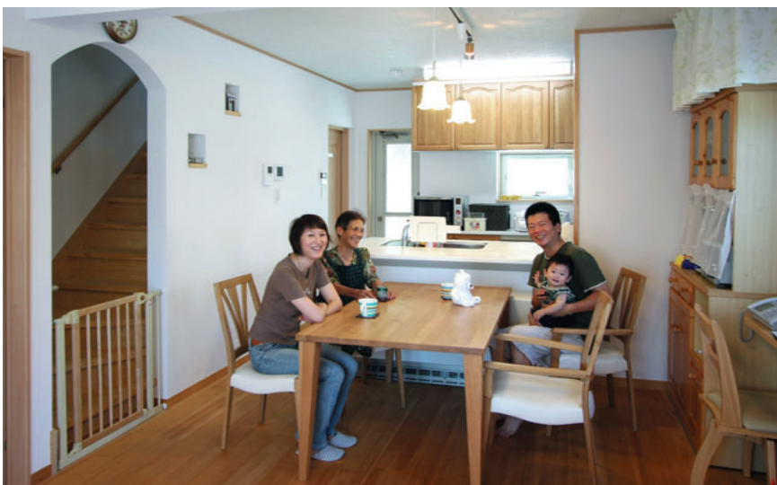
家族の会話も弾む明るいリビングダイニング。収納を考えてセミオープンにしたキッチンからはお子さんの遊ぶ様子が見渡せます。お子さんが大きくなったときの家族のコミュニケーションを考えて2Fへの階段をリビング階段にしました。