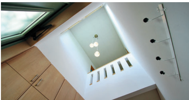
「吹き抜けのある家に住みたかった」とご主人。2Fの南向きの窓から玄関ホールや2F廊下に光が差し込み、明るく気持ちのいい空間に仕上げました。