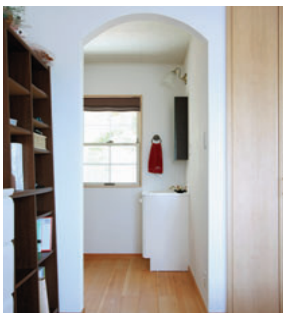
アーチ型の入口を通して寝室へ。右のドアは夫婦2人分の季節の洋服が全部入るというウォークインクローゼット。天井は電気を消すと星座が浮かび上がるロマンチックな夜空です。