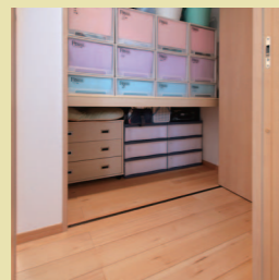
背合わせに作った収納棚。リビングに面した収納棚は頻繁に出し入れをするものを収納。裏の収納棚(右写真)は、浴室前の廊下に面しており入浴後のタオルや着替えを収納しています。