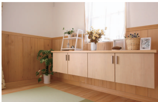
通常の収納にしてしまうとその分お部屋が狭くなりますがこの収納棚だと広さも確保でき、また下部に空間があるのでお掃除がしやすくするという一石二鳥の収納なんだそう。窓ともグッドバランスですね。