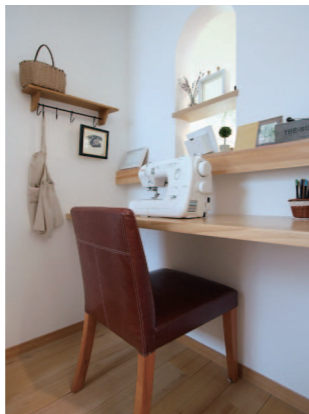
お隣の写真の手前左側に設けた、食品庫兼奥様専用のユーティリティスペース。小窓からリビングを見渡せるので家事をしながらでも子供たちに目が届きます。