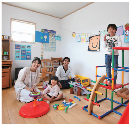
長男R君の子供部屋ももちろんもみの木フロア。人体に有害といわれるプラスイオンを吸着し、逆にリラックス効果をもたせるマイナスイオンを発生させる健康塗り壁を使用しています。R君が毎日すくすくと育っていることがこのお部屋から伝わります。