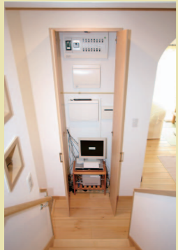
リビングテレビ台の裏面に、なくてはならない設備ですが、インテリア上では邪魔な存在である配電盤や換気システムをまとめて隠しておく収納が、GOODアイデアです!