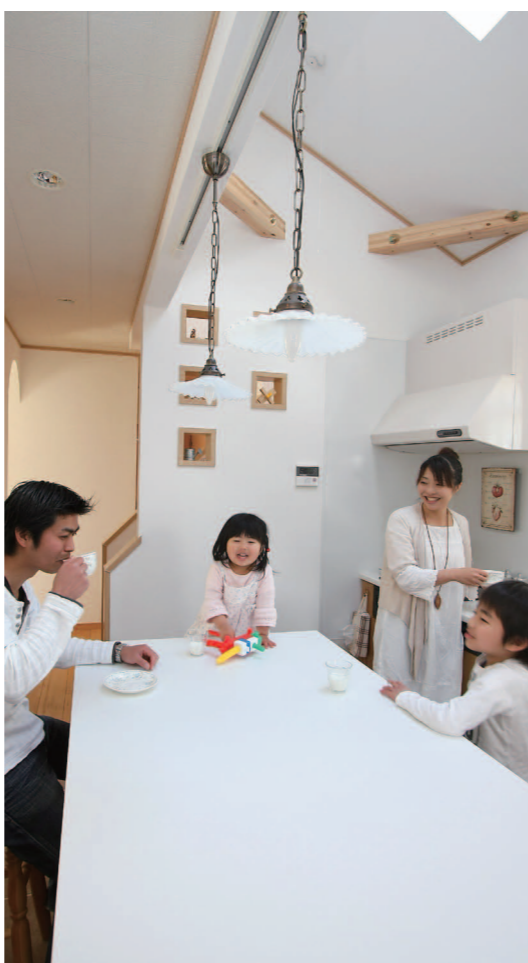
照明無しでこの明るさは驚き。ご主人の背中側にリビングがあり、正面に見える5つの飾り窓がある壁の向こうには2階に続く階段があります。階段の向こう側奥には浴室と洗面所があり、家事導線も優れた造り。洗面所に勝手口を設けており、ここからウッドデッキにつながっています。