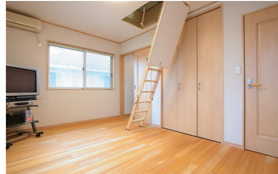
ご夫婦の寝室。もみの木フロアに家族4人、川の字で休まれるそう。梯子は屋根裏部屋に続きます。