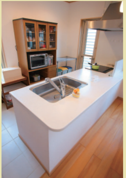
「パーティキッチン」常に水回りがオープンになるので当初奥様は大反対されたそうですが、ご主人に押し切られたそうです。「使ってみるといつも家族に目が届くので、大正解でした」と奥様。