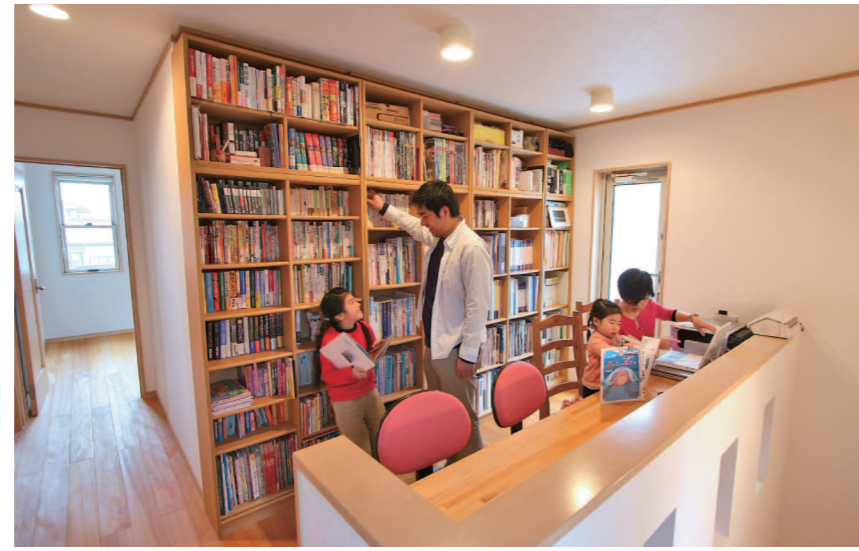
わが家の「図書室」！ 福祉のお仕事をされているご夫婦は仕事柄、調べ物や書類作成など自宅で行う仕事も多いとのこと。そこで書庫と書斎、それから子供たちも共に勉強できるスペースを作られました。右下のスペースが1階からのリビング階段になっています。