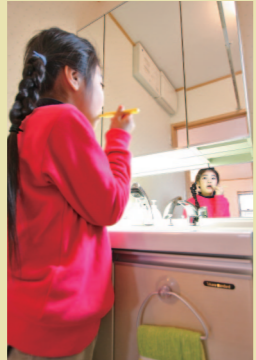
この鏡、普通の鏡台と違うんです。わかりますか？鏡台の下部にも鏡を貼っているんですね。子供たちの視線にあわせて優しい設計です。