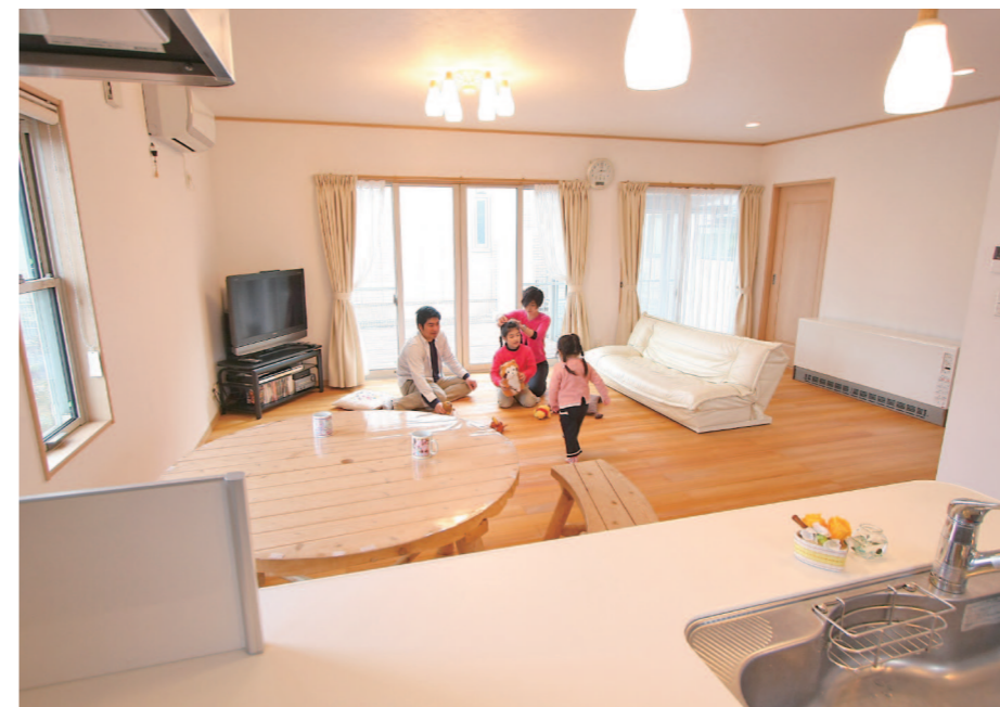
もみの木フロアと大きな窓から差し込む陽射しがまるでスタジオのよう。「なるべく家具を置かないようにしているのでホコリもとやすく、お掃除も簡単です」と奥様。ソファを開いて移動してここで子供たちが縄跳びの練習をしたりするそう。

1階はリビングがダイニングの1部屋だけ。魅せる「パーティキッチン」はもみの木の相性も抜群！ 消臭効果で調理時のにおいも解消。