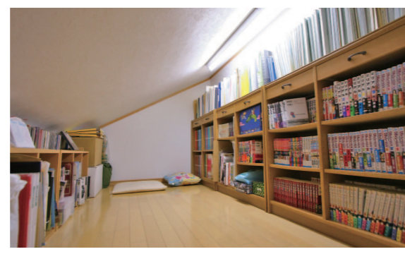
屋根裏部屋はマンガや趣味の本を集めた第二の図書室。照度の高い蛍光灯を設置しているので十分な明るさ。収納部屋ではなく、寝転がってマンガを読み耽ったりするためのお部屋だそうです。うらやましいですね。