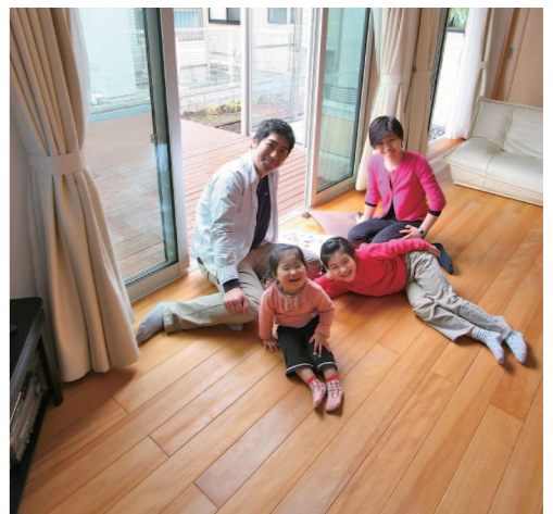
もみの木の感触は思った以上に気持ちよく、家族全員とも普段は裸足ですごされているそう(今日は撮影があるので靴下を履いていらっしゃいました)。もみの木ファミリーの共通点「スリッパはおきません」は1様邸にも。

「宿泊体験」は仙台市内にあるモデルハウスに実際に宿泊して頂けるシステム。電化製品や食器、寝具、タオル等はモデルハウスにあり、お客様は食料だけ持参頂きます。お料理や入浴など自由にお泊まり頂き、もみの木の良さ、ぜひ自身でご家族で感じて下さい。