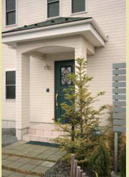
ご入居後にご主人が植えられたもみの木。

CASE10:岩手県一関市 1さんのお宅 家族構成:夫・妻・長女(小学2年生)、次女(年少) 延べ床面積:34坪 部屋:4LDK こだわり設備:1階・2階とも全フロアにもみの木+全室に健康塗り壁 +1階スピノフ施工。