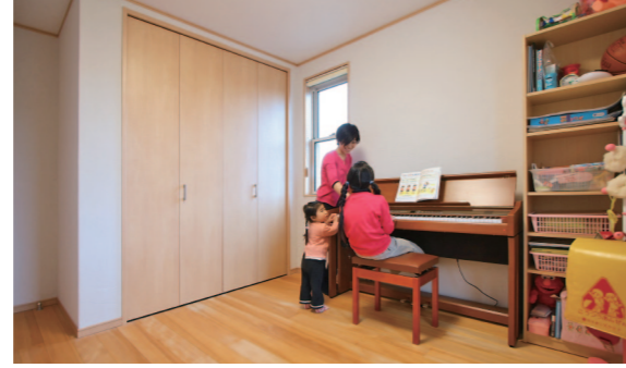
長女KRちゃんのお部屋。子供部屋なのに勉強机がありません。なぜなら、お勉強はわが家の「図書室」です。

「宿泊体験」は仙台市内にあるモデルハウスに実際に宿泊して頂けるシステム。電化製品や食器、寝具、タオル等はモデルハウスにあり、お客様は食料だけ持参頂きます。お料理や入浴など自由にお泊まり頂き、もみの木の良さ、ぜひ自身でご家族で感じて下さい。