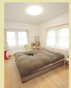
ピアノや釣り道具などご主人の趣味の部屋と寝室。大容量のウォーキングクローゼットなど収納をたくさん作ったのでどの部屋もすっきりとしています。