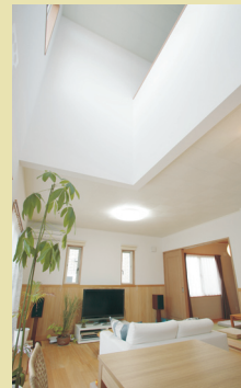
リビングから見上げると吹き抜けが。光が差し込む明るい空間です。

家族構成：夫38歳、妻29歳、猫ちゃん1歳 延べ床面積：38.08坪 部屋：4LDK こだわり設備：床材はもみの木の木内装材 床暖房 バイオウォール