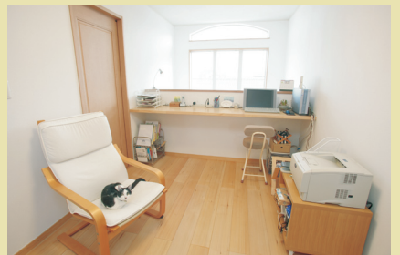
2Fのホールを広げて、スタディー룸にしました。眺めの良い心地よい空間はご主人のお気に入り。吹き抜けを通して1Fの奥さまと会話もできます。