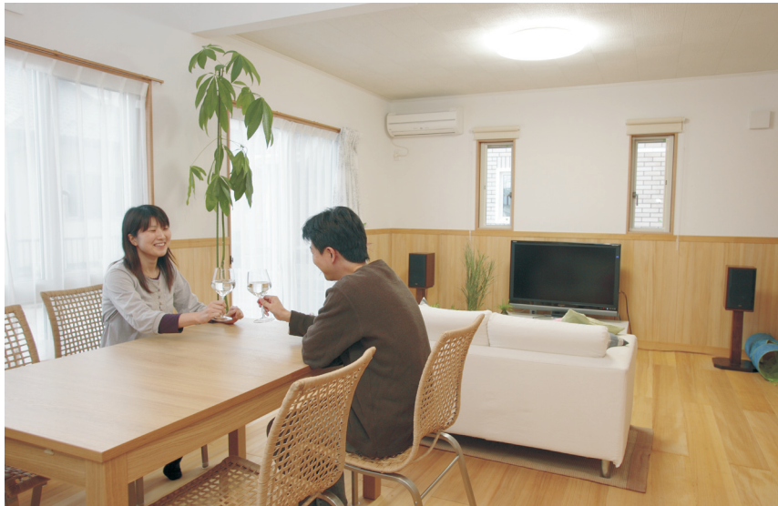
引越しをしたら、10数年前から使っていたスピーカーの音質が断然良くなったことに気がついたとか。ジャズを聴きながら、家で飲む時間も増えました。